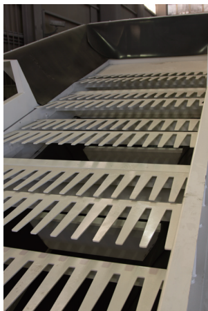
<用途に合ったフィンガー形状>